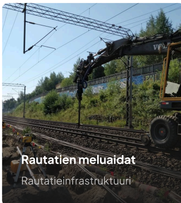
Rautatien meluaidat Rautatieinfrastruktuuri