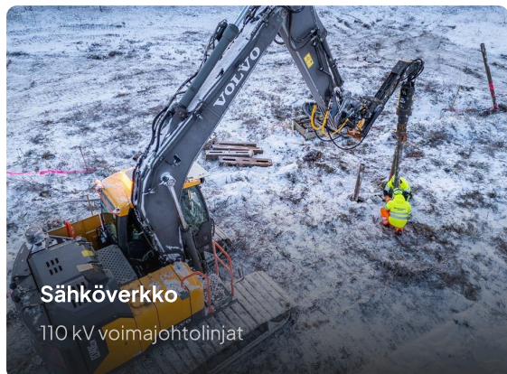
Sähköverkko 110 kV voimajohtolinjat